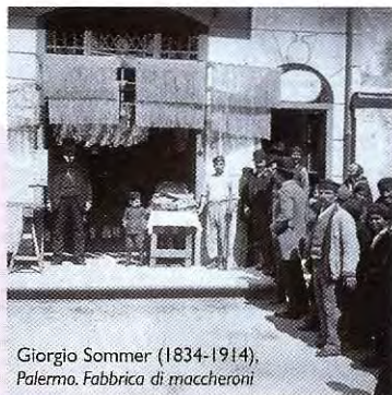
Giorgio Sommer (1834-1914). Palermo. Fabbrica di maccheroni

guardare le nostre terre con "persone" (gli agricoltori) quali "tutori" dell'ambiente, evitando degrado e dissesto del territorio. I "prodotti" locali sono il risultato dell'applicazione di saperi e tecniche detenute e tramandate alle risorse di un luogo particolare, in un tempo determinato e in relazione a particolari condizioni ambientali di terra, acqua e clima: sono un "patrimonio" generato in condizioni di minimo impatto ambientale e sociale, in una sostanziale re-