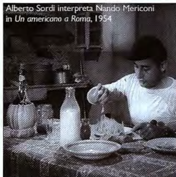
Alberto Sordi interpreta Nando Mericoni in Un americano a Roma , 1954

circa 450.000 quintali e le regioni maggiori produttrici sono il Veneto, l’Emilia Romagna, la Toscana, il Molise, l’Abruzzo, il Lazio, la Campania e la Sicilia. Le numerose popolazioni d’aglio coltivate, circa 300 varietà, di cui 30 coltivate in Italia, si raccolgono in due ecotipi fondamentali: l’aglio bianco o comune e l’aglio rosa/rosso. Tra le specie “tipiche italiane” più apprezzate ricordiamo il Polesano (Vene-